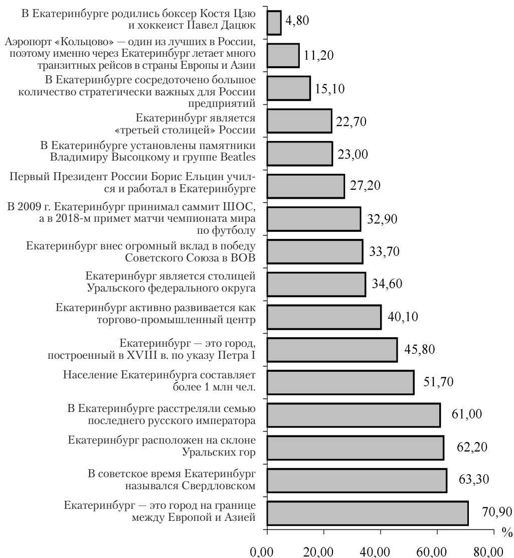
Рис. 1. Преобладающие черты позитивного образа Екатеринбурга (факты о городе, желающих упомянуть которые перед иностранцами оказалось больше, чем желающих умолчать о них):

проценты отражают превышение доли тех, кто обязательно упомянул бы соответствующий факт, над долей тех, кто постарался бы его не афишировать (например, про факт «Екатеринбург — это город, который расположен на границе между Европой и Азией» обязательно постарались бы упомянуть 80,8 %, тогда как умолчать про этот факт постарались бы 9,9 % — в итоге мы видим разницу в долях 70,9 %, именно она и отражена на диаграмме). Здесь и на рис. 2 проценты в обоих случаях вычислены от общего числа опрошенных (474 чел.)