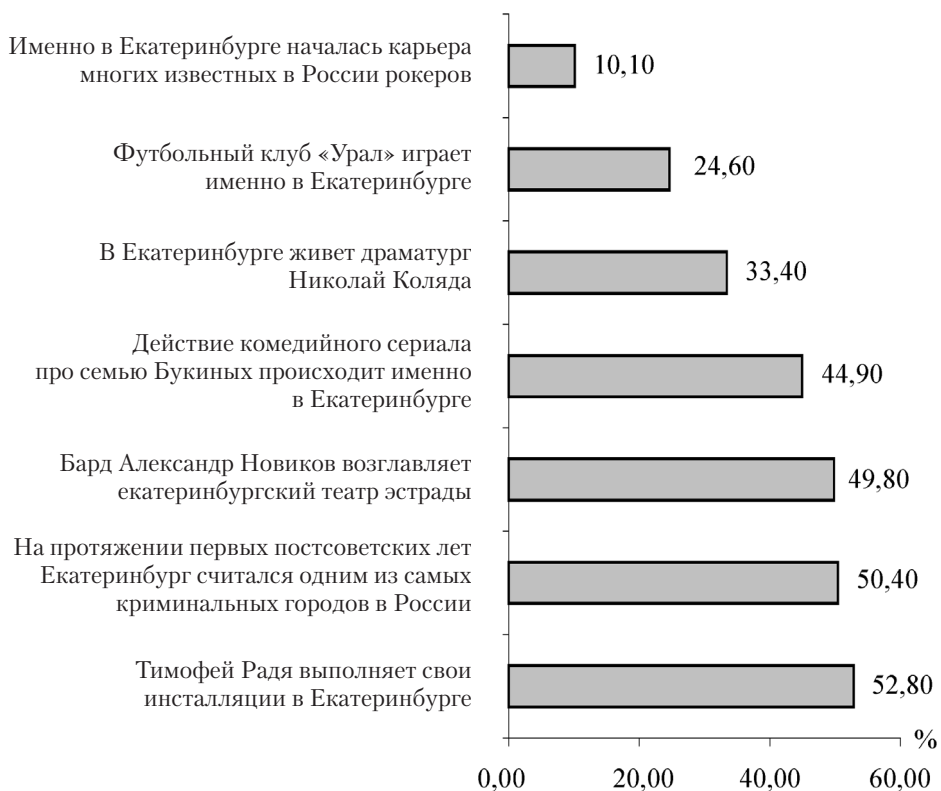
Рис. 2. Преобладающие черты негативного образа Екатеринбурга (факты о городе, желающих упомянуть которые перед иностранцами оказалось меньше, чем желающих умолчать о них):

проценты отражают превышение доли тех, кто ни в коем случае не стал бы упоминать соответствующий факт, над долей тех, кто постарался бы его упомянуть обязательно (например, про факт, что в Екатеринбурге работает художник Тимофей Радя, не стали бы упоминать 61,0 % опрошенных, а постарались бы упомянуть 8,2 % — в итоге мы видим разницу в долях 52,8 %, именно она и отражена на диаграмме)