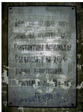
6. Вкладная запись алтаря церкви Нерукотворного Спаса. 1859–1879, с. Матвинур, Санчурский р-н, Кировская обл.