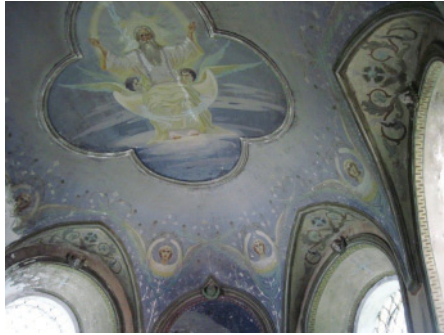
8. Свод алтаря церкви Нерукотворного Спаса. 1859–1879, с. Матвинур, Санчурский р-н, Кировская обл.