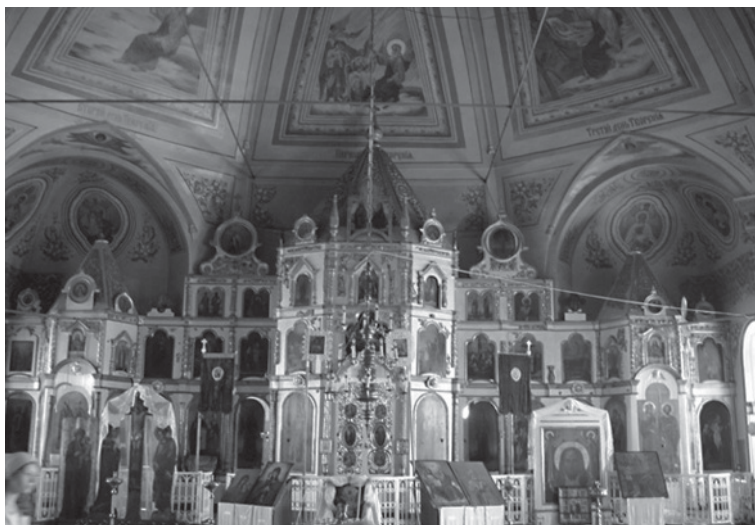
5. Вид на алтарную часть церкви св. архангела Михаила. 1906, с. Уртма, Яранский р-н, Кировская обл. 5. A view of the altar part of the Church of St. Michael the Archangel. 1906, Urtma Village, Yaransk District, Kirov Region.