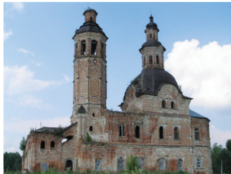
2. Церковь Спаса Нерукотворного. 1776, с. Вяз, Кирово-Чепецкий р-н, Кировская обл. Восстанавливается.

1. Church of the Icon of Our Lady of Vladimir. 1771–1776, Verkhnie Kумыony Village, Kумыony District, Kirov Region. Inactive.