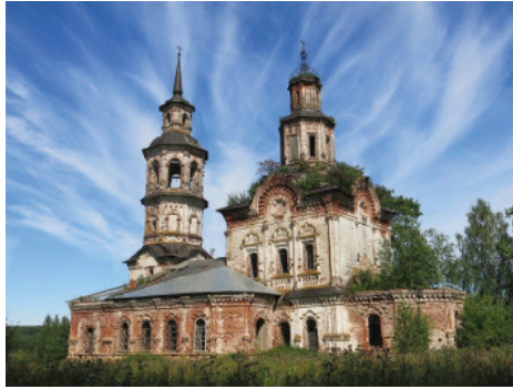
1. Церковь иконы Божией Матери Владимирской. 1771–1776, с. Верхние Кумёны, Куменский р-н, Кировская обл. Не действующая.

1. Church of the Icon of Our Lady of Vladimir. 1771–1776, Verkhnie Kумыony Village, Kумыony District, Kirov Region. Inactive.