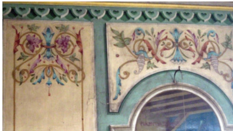
9. Роспись алтаря церкви святого Николая Чудотворца. 1893, с. Беляево, Кикнурский р-н, Кировская обл. Фрагмент.