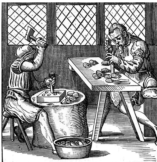
Ил. 4. Йост Амман. Изготовление наперстков, 1568 г. (по: Jost Amman's Stände und Handwerker... Der Fingerhüter )