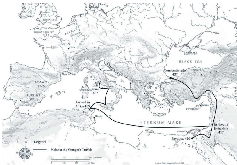
Ил. 3. Путешествия Мелании Младшей (по: Platte E. L. Monks and Matrons: The Economy of Charity in the Late Antique Mediterranean: Doctoral Dissertation. University of Michigan, 2013. P. x ).