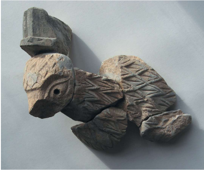
Ил. 1. Фрагмент ласпинской капители с орлами. Общий вид. 2023. Fig. 1. Fragment of the capital with eagles from Laspi. General view. 2023.

Обращает на себя внимание край уцелевшей части фигурки орла, где оперение примыкает к сильно поврежденному выступу с дуговидным абрисом. Достаточно большой представляется вероятность того, что последний принадлежал именно арочному обрамлению акантового листа, который в таком случае должен был находиться исключительно на продольной или поперечной оси архитектурной детали (ил. 2). Несмотря на многочисленные примеры украшения капителей скульптурными изображениями различных птиц 4 , даже сколько-нибудь близкие аналогии ласпинской находке неизвестны, а сама она по праву может считаться раритетным произведением местной каменной пластики