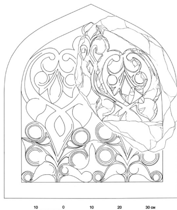
Ил. 7. Лицевая сторона архитектурной детали. Реконструкция. Чертеж автора

С большой долей вероятности можно предположить, что оба фрагмента не только принадлежали одному и тому же изделию, но даже стыкуются друг с другом со стороны сколов, правда, последнее, пока они находятся в разных местах, проверить трудно. Основанием для такого вывода является их исключительное стилистическое тождество и полная сопоставимость размеров. Как бы там ни было, первоначальный вид плиты поддается достаточно уверенной реконструкции (ил. 7). Она представляла собой довольно массивную и приземистую стелу со стрелчатым завершением, лицевая сторона которой была полностью покрыта резным