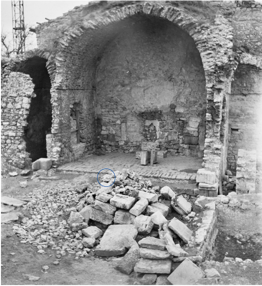
Ил. 4. Северный айван медресе. Вид с юго-востока. 1987.