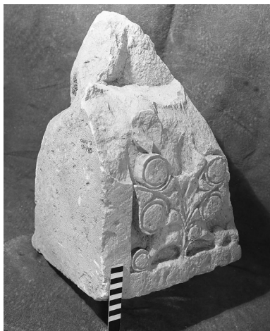
Ил. 6. Фрагмент архитектурной детали из раскопок 1983 г. Снимок 1989 г.

Известна еще одна подобная лапидарная находка (ил. 6), во многом сопоставимая с предыдущей. Она была обнаружена при раскопках 1983 г. в переотложенном состоянии, на что указывают маркировка (СКАЭГЭ 134/83) и соответствующая отметка в кол-