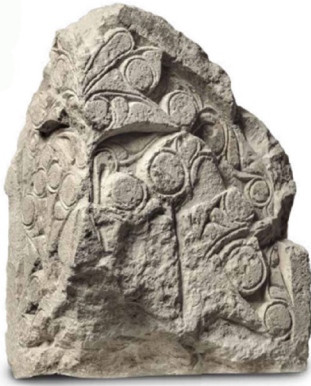
Ил. 8. Архитектурная деталь из раскопок 1979 г. (по: Крамаровский М. Г. Архитектурная деталь... С. 307. Кат. № 265)

растительным орнаментом с ленточным обрамлением по периметру, а тыльная грань не предусматривалась для экспонирования. Ее предполагаемые размеры: высота – 69 см, ширина – 62 см, толщина – 33 см. Само изделие следует считать архитектурной деталью. Объективности ради необходимо отметить, что подобные формы были характерными для мусульманских надгробий, но относить его к их числу вряд ли стоит, поскольку надмогильным памятникам золотоордынского Крыма такие пропорции, величины, да и, собственно, декоративное убранство совершенно не свойственны 13 .