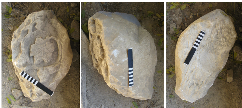
Ил. 1. Фрагмент резного изделия. Вид спереди. 2020.