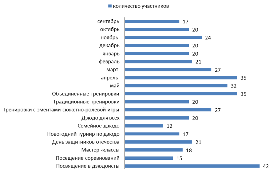
Рисунок –1 Данные по посещаемости секции дзюдо дошкольниками 5–6 лет в течение года

Результаты исследования. На рисунке 1 представлена посещаемость занятий секции дзюдо в течение 9 месяцев с сентября 2018 года по май 2019 года и отражено количество участников спортивных праздников, тренировочных занятий, проводимых в традиционной форме и с использованием сюжетно-ролевых игр, а так же организации совместных занятий с детьми из разных учебных групп.